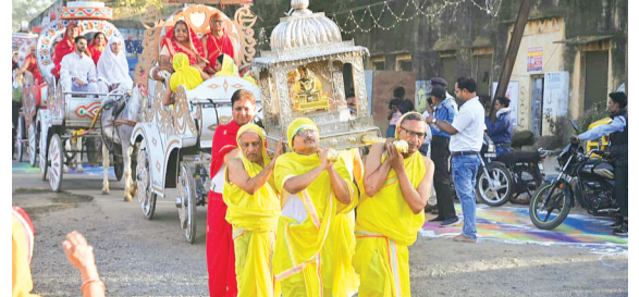
रहे थे। दिव्यघोष, बैंड-बाजों और भक्तों के भजन-कीर्तन के साथ संपूर्ण वातावरण धर्ममय हो गया। महिलाओं ने अपने कलश के जल से मंडप की शुद्धि की तथा प्रमुख पात्रों द्वारा वेदी शुद्धि की गई।