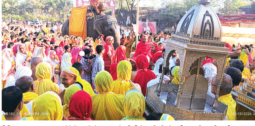
विदिशा। पंचकल्याणक शुरू होने के पहले जैन समाज ने मुनिश्री के मार्गदर्शन में हाथी पर धर्मध्वजा निकाली।