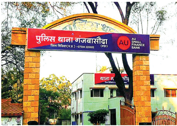
उसकी नाबालिग पुत्री उम्र 16 वर्ष 08 माह को दिनांक 21.02.2026